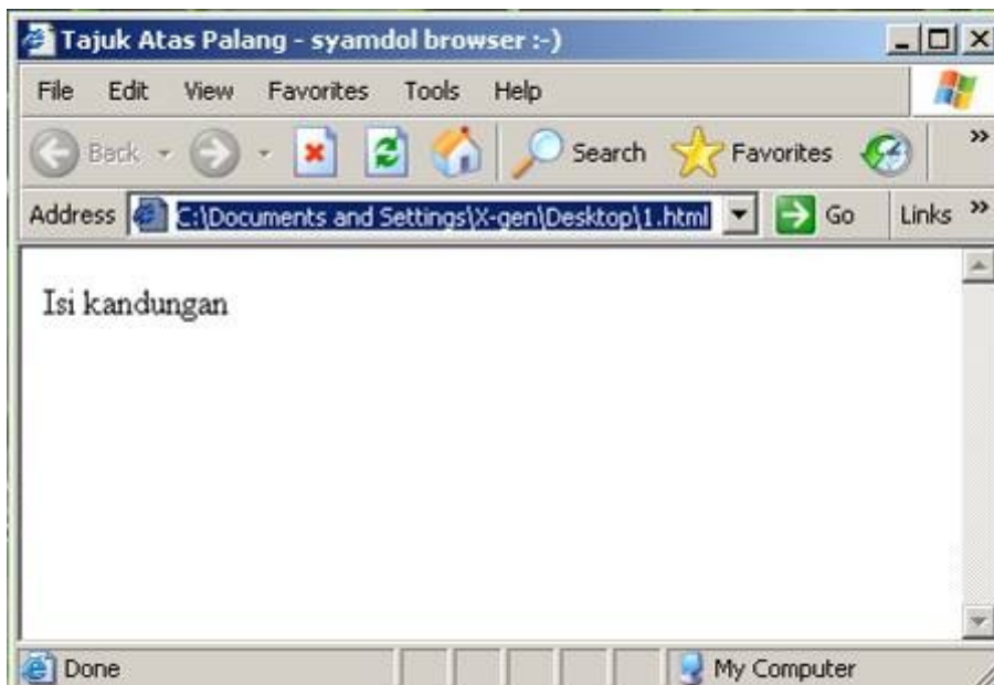
Gambarajah 1: halaman web yang dibina menggunakan kod HTML

<HTML> <HEAD> <TITLE>Tajuk Atas Palang</TITLE> </HEAD> <BODY> Isi kandungan </BODY> </HTML>